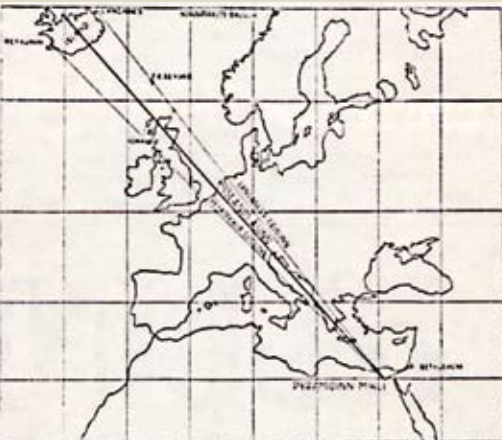
Skýringamynd úr riti Adams Rutherford, Hin mikla arfleifð Íslands, sem út kom á íslensku árið 1939. Myndin sýnir á hvern hátt Pýramíðinn mikli vísar á Ísland annars vegar og Betlehem hins vegar.